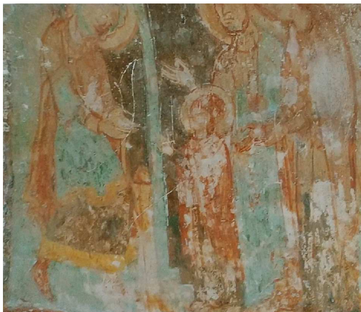
Рисунок 2. – Сюжет «Введение во храм»

Из сюжетов богородичного цикла наилучшим образом сохранилась композиция «Введение во храм» (рис. 2). Это обычный сюжет для системы церковной росписи, относящийся к «Двенадцатым праздникам». Он располагается на южной стене восточного рукава молельни, в верхнем регистре над деисусным чином. Сохранность удовлетворительная. Так же едва просматривается сюжет «Рождество Богородицы», который находится на западной стене капеллы, слева от входа.