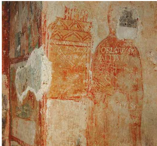
Рисунок 3. – Св. Евфросиния Полоцкая подносит храм Иисусу Христу. Ктиторская фреска.

Одним из главных сокровищ росписей кельи является ктиторский портрет преп. Евфросинии Полоцкой (рис. 3), подносящей Иисусу Христу, как дар своей веры, Спасский храм, миниатюрную модель которого она держит в протянутых ко Спасителю руках. К сожалению, ее лик утрачен, но само изображение является неоценимым свидетельством очень раннего формирования почитания святой, начавшего складываться уже в Домонгольский период. Преподобная Евфросиния изображена без нимба, что указывает на принадлежность фрески к тому периоду, когда она еще не была причислена к лику святых.