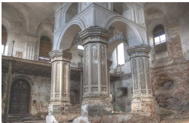
Рисунок 3. – Бима синагоги в Быхове

строили над основным залом дополнительное помещение. Плоскую крышу сменила двускатная. Примыкавшая к синагоге территория была застроена религиозными и другими, принадлежащими общине, зданиями. Однако к сегодняшнему дню они не сохранились.