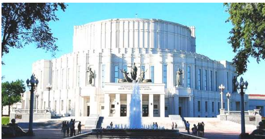
Рисунок 1. – Большой оперный театр, город Минск

Рядом с центром находятся 2 станции метро, остановки 11 автобусных и троллейбусных маршрутов, 17 маршрутных такси. В шаговой доступности располагается Galleria Minsk. Но они не конкурируют, поскольку в многофункциональном центре «BRUTTO» более развита развлекательная часть и в совокупности с Galleria Minsk насыщают современными функциями историческую часть города.