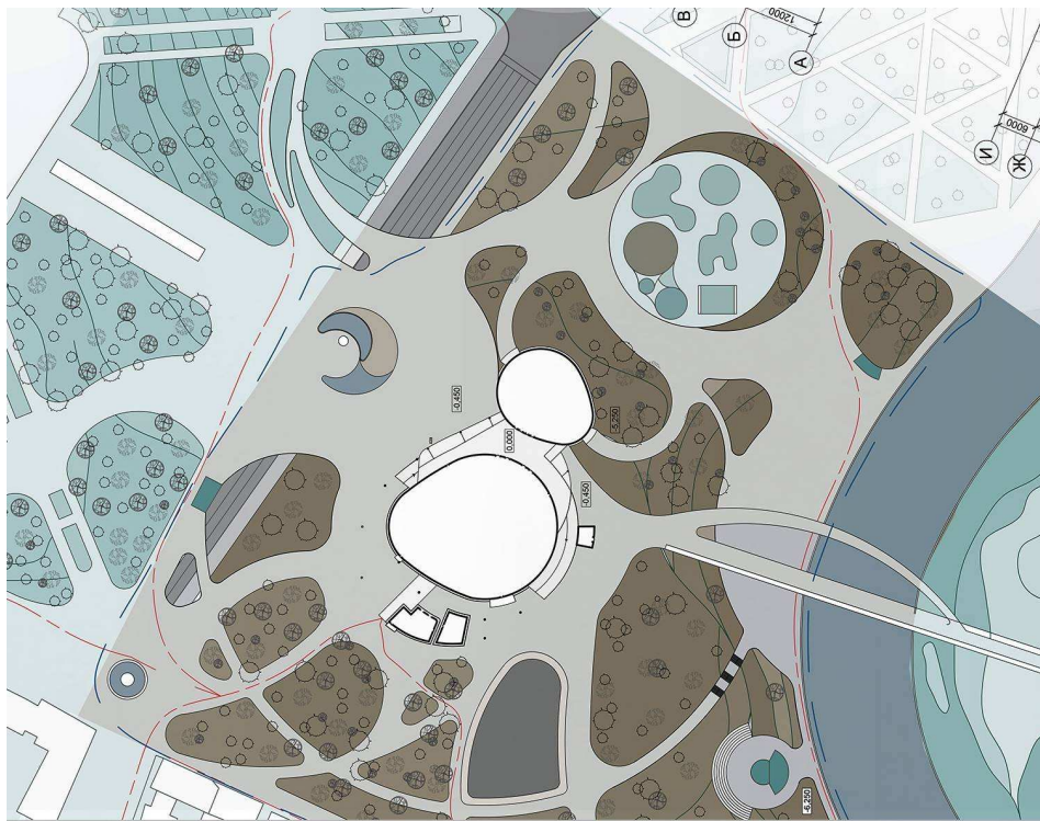
Рисунок 4. – Генеральный план многофункционального общественного центра «BRUTTO» по улице Янки Купалы в городе Минске (авторский проект)

В заключение проведенного исследования можно сделать вывод : данная предложенная разработка проекта многофункционального общественного центра, объединившая транспортную, торговую, офисную и развлекательную функции, его месторасположение, позволяет создать необходимые условия для шопинга, развлечения и отдыха жителям и гостям города.