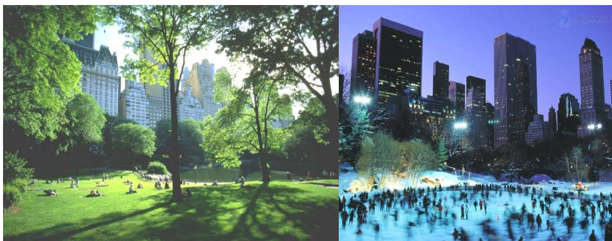
Рисунок 3. – Использование озера в центральном парке в Нью-Йорке в разное время года

Еще один показатель доступности общественного пространства – это возможность его использования в различное время суток и поры года (рисунки 3, 4).