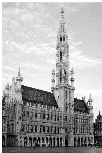
Рисунок 1. – Ратуша в Брюсселе

Наиболее полное представление о классическом образе ратуши можно получить при достаточно подробном рассмотрении примера – широко известной городской ратуши в Брюсселе (рисунки 1, 2).