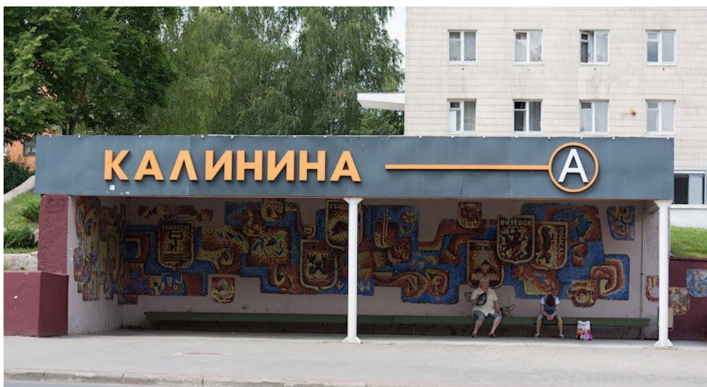
Рисунок 2. – Остановка на улице Калинина, г. Новополоцк. Мозаика

маршрутного транспорта. Чтобы скрасить время ожидания маршрута, пришлось разнообразить монотонные однотипные павильоны. Благодаря необычным рисункам конструкции приобретали особенный вид и становились целым произведением искусства. Появились остановки в виде птиц, гнезд и т.д. Потом на остановках стали появляться такие материалы как кирпич, металл и витражи, стекло.