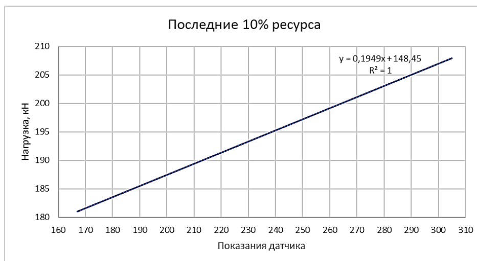
Рисунок 2 – Зависимость нагрузки (последние 10% ресурса образца) от показаний глубинного датчика

Как видно из рисунков 1-2 модель, получаемая с глубинного датчика, позволяет предсказывать нагрузку образца с точностью 99%, а остаточный ресурс (последние 10%) с точностью 100%.