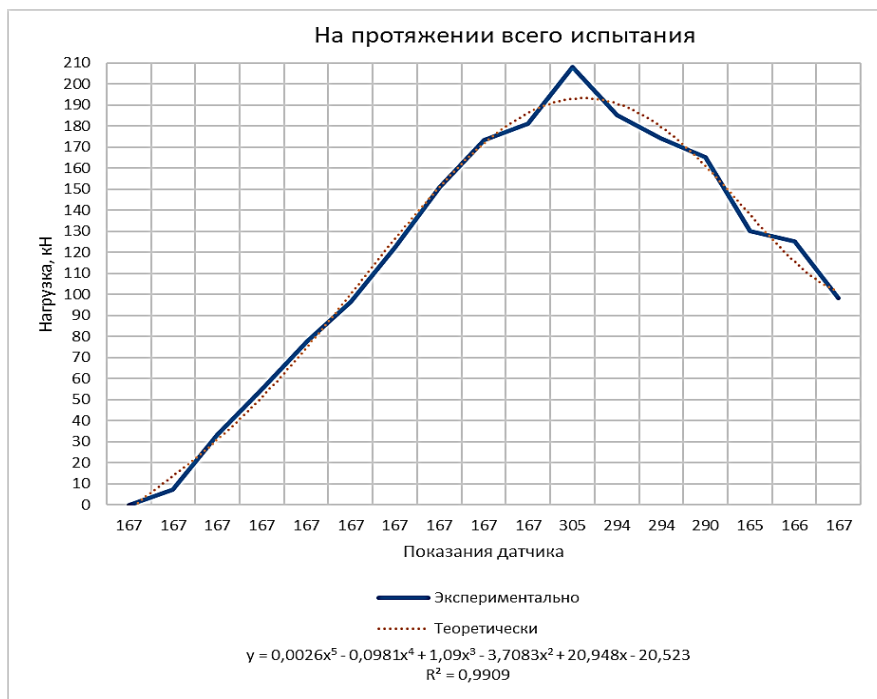
Рисунок 1 – Зависимость нагрузки от показаний глубинного датчика