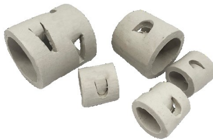
Рисунок 2. – Кольцо Палля

Элементы кольцевой насадки представляют собой цилиндрические тонкостенные кольца, наружный диаметр которых обычно равен высоте кольца. Диаметр насадочных колец изменяется от 10 до 150 мм. К кольцевым насадкам относятся кольцо Рашига, Палля (рисунок 2), Лессинга и с крестообразной перегородкой.