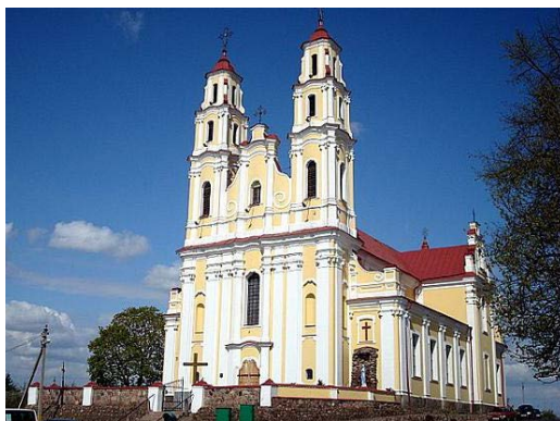
Рисунок 1. – Костел Святой Троицы

Другой храм – это собор Рождества Пресвятой Богородицы. Данный храм в городе Глубокое был основан в 1639 году и долгое время являлся костелом католического монастыря кармелитов. В 1865 году, после поражения восстания, в котором монахи принимали активное участие, католический монастырь был упразднен, и через некоторое время храм был переоборудован под православную церковь. Этим и объясняется его нетипичный для церквей внешний вид и сходство с Троицким костелом, расположенным неподалёку.