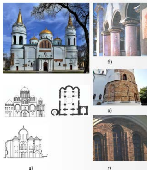
Рисунок 3. – Спасский собор: а) чертежи храма; б) романская колоннада; в) цилиндрические романские ниши западной башни; г) романские оконные проемы

Спасский собор заложен около 1030–1034 годов черниговским князем Мстиславом Владимировичем. Расположен в городе Чернигове. В конструкции Спасского собора использована византийская крестовая схема с элементами романских базилик. В интерьере храма можно увидеть колонны из белого мрамора с капителями ионического типа с импостом (рисунок 3) [4].