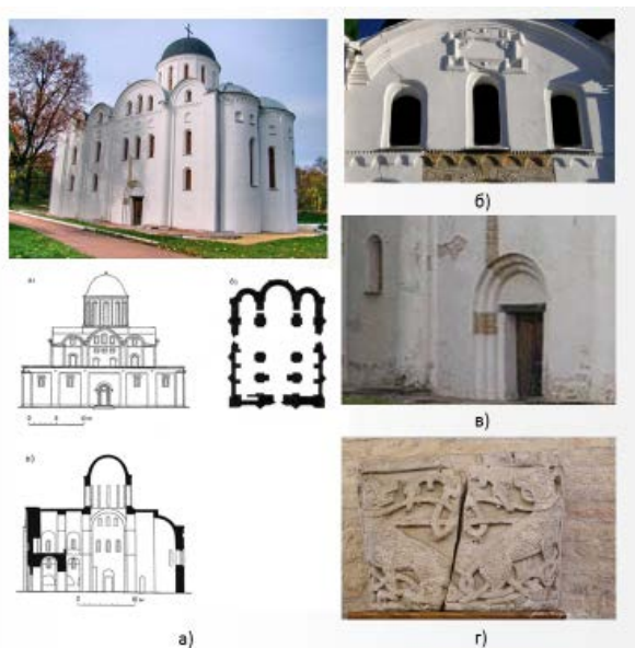
Рисунок 2. – Борисоглебский собор: а) чертежи храма; б) аркатурный пояс северного фасада; в) романский портал южного фасада; г) романская капитель

Борисоглебский собор – усыпальница князей рода Давидовичей, построенная в 1120–1123 года. Находится в городе Чернигове. В храме Борисоглебского собора наблюдаются характерные черты романского стиля: к пилястрам приставлены полуколонны, увенчанные капителями; в декор были введены белокаменные резные детали; карнизы, архивольты, капители, столбы и даже маски здания приобрели большую компактность, строгость и законченность (рис. 2).