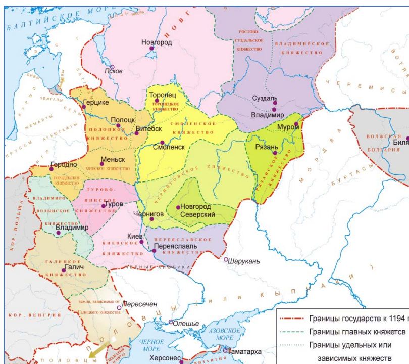
Рисунок 1. – Русские княжества в 12 веке

Стоит отметить что огромное значение на проникновение романики, в первую очередь оказывало географическое положение Чернигова (ри. 1). Справедливо отметить общую особенность при изучении влияния романского стиля на русские княжества, а именно чем дальше расположено княжество от европейских культурных центров того времени, тем слабее в нём выражено влияние зарубежной архитектуры и ярче выражены местные особенности.