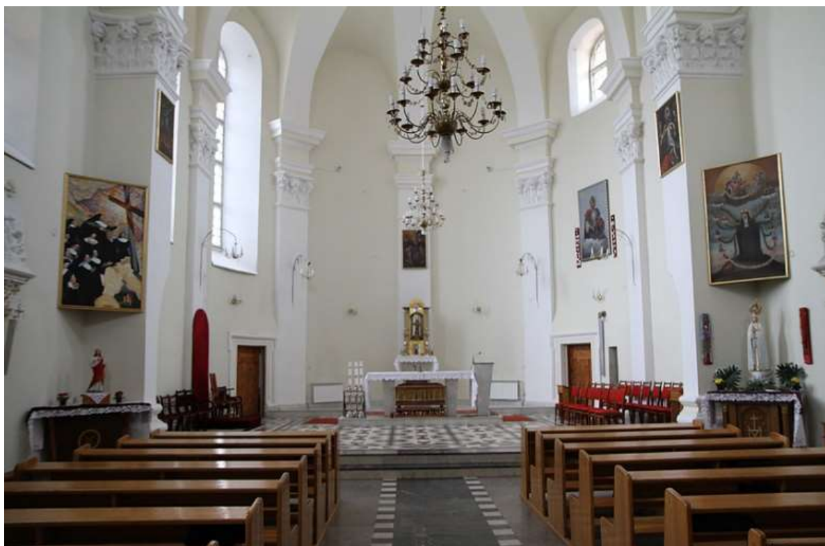
Рисунок 5. – Интерьер монастыря

В боковых нефах и под хорами размещены 14 барельефных сюжетно-скульптурных панно на тему Крёстного пути Христа. Интересной особенностью интерьера бригитского костёла является то, что в нём орган расположен не на хорах, а на балконе правой стороны стены (рисунок 5 [9]) [6].