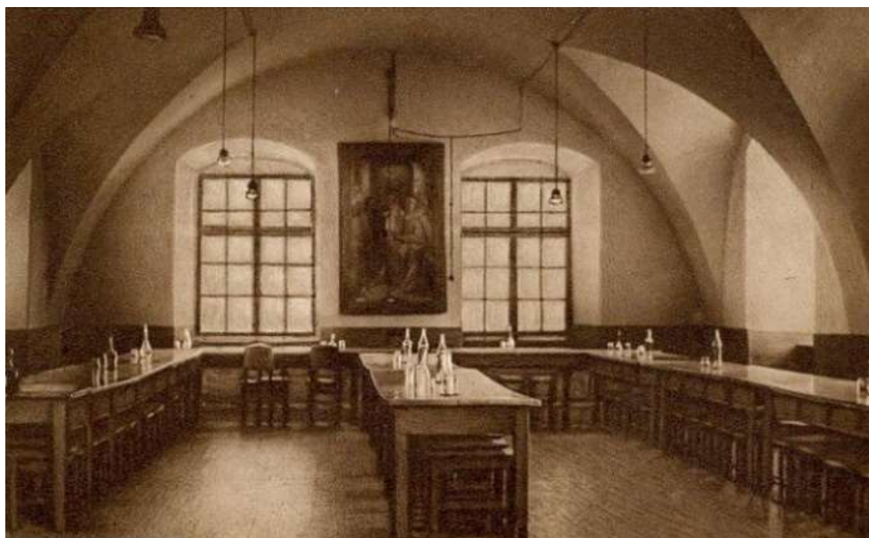
Рисунок 8. – Трапезная монастыря

Фасады ритмично разделяются маленькими прямоугольными оконными проёмами в простых планках, объединённых широким карнизом. На северном фасаде сохранился портал, украшенный художественной штукатуркой. По периметру строения со стороны двора проходит световой коридор с кельями. В юго-западном углу монастырского комплекса – отдельная пристройка, на первом этаже которой была трапезная, на втором – библиотека (рисунок 8 [9]) [8].