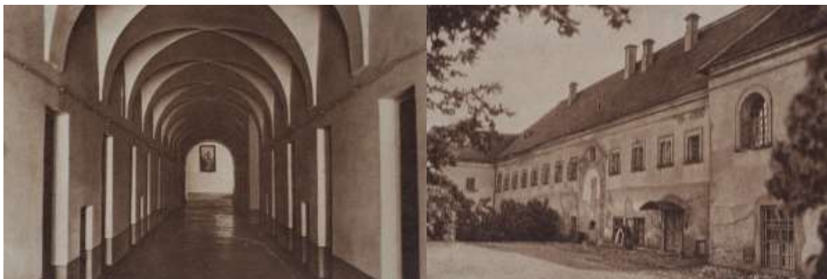
Рисунок 6. – Вид коридоров-галерей монастыря