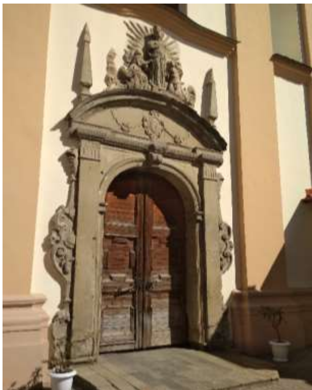
Рисунок 2. – Деталь портала главного входа