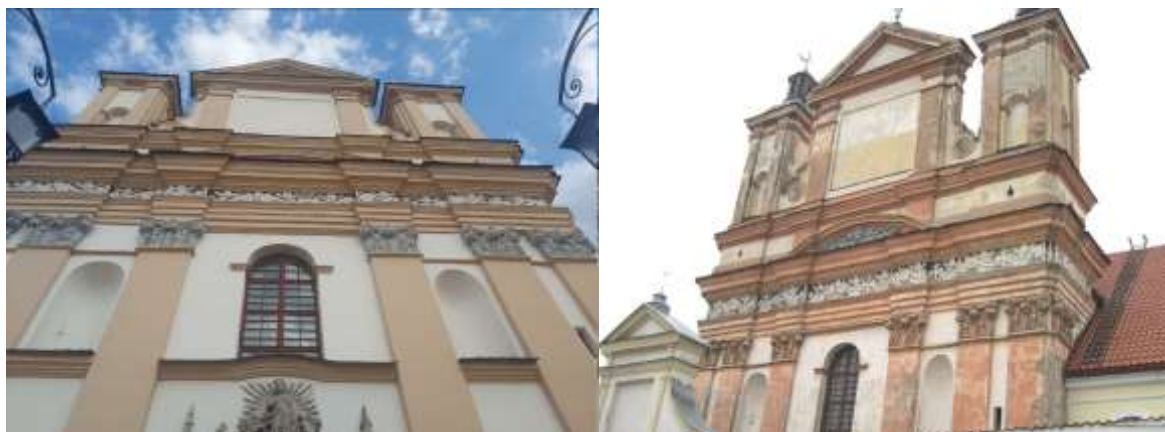
Рисунок 1. – Главный фасад храма

Экстерьер. Костёл представляет собой однефный двухбашенный храм с полуциркульной (полу-круглой) апсидой, накрытый общей высокой черепичной крышей. Фасады разделены полуциркульными (полукруглыми) оконными проёмами и крапирован в простенках коринфскими пилястрами, объединёнными общим антаблементом. Особый интерес представляет стена главного фасада, решённая по барочному декоративно-пышно, как театральный занавес для композиции скромного храма (рисунок 1 [9]). Она шире, чем неф, поскольку органично включает боковые башенки, размещённые по углам сооружения [2].