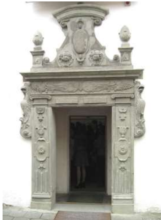
Рисунок 3. – Портал бокового входа