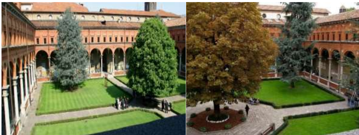
Рисунок 5. – Благоустройство одного из дворов Болонского университета

Для обеспечения доступности исторических корпусов для всех групп населения вмонтированы скрытые лифты, а кирпичные мостовые заменены на гладкое покрытие, удобное для людей с ограниченной подвижностью, (рисунок 5 [9; 10]).