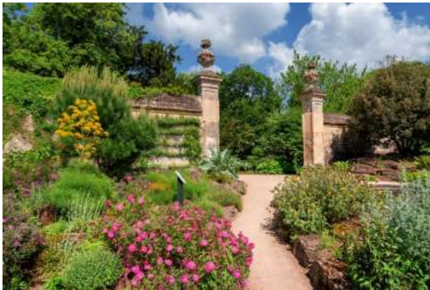
Рисунок 3. – Один из садов внутреннего двора студгородка на территории университета Оксфорда

Сады колледжей (как в Мертон-колледже) дополнены экотропами с информационными стендами о местной флоре (рисунок 3 [6]).