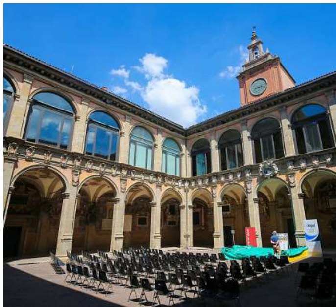
Рисунок 4. – Использование одного из внутренних дворов Болонского университета для проведения мероприятия

Болонский университет. Университет Болоньи, основанный в 1088 г. и считающийся старейшим в Европе, изначально не имел собственного комплекса зданий. Лекции и занятия проводились в различных местах, таких как церкви и арендованные помещения. Только в XVI в. было построено первое специализированное здание – дворец Архигимназии. В его внутреннем дворе проходили важные мероприятия, такие как дебаты и экзамены. Сегодня, в здании Архигимназии, построенном в XVI в. и служившем местом для научных дискуссий, располагаются публичная библиотека, музей и центр цифровых архивов. Реставраторы бережно сохранили уникальные фрески с гербами студентов, а также установили современное оборудование, включая бесшумные системы вентиляции, для комфорта посетителей [7]. Общественные площади Пьяцца Маджоре и Пьяцца Верди превращены в открытые аудитории – теперь здесь проводят научные фестивали, устанавливают мобильные павильоны для лекций, а под портиками размещены цифровые табло с расписанием мероприятий (рисунок 4 [8]).