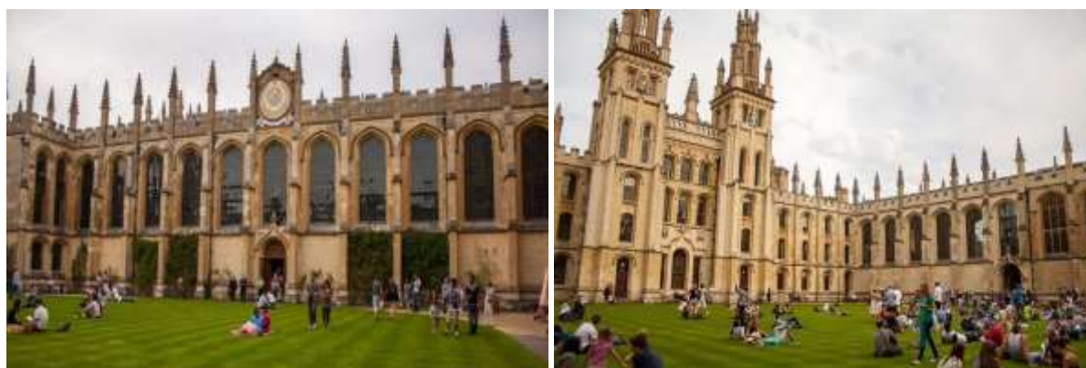
Рисунок 2. – Закрытые исторические дворы-квадраты Оксфорда

Оксфордские дворы, изначально задуманные как часть архитектурного ансамбля, сегодня выполняют разнообразные роли. Они служат учебными аудиториями, площадками для торжеств и местами для отдыха. Например, исторические дворы (рисунок 2 [4; 5]), предоставляют пространство для летних лекций, кинопоказов и комфортных зон отдыха, оборудованных мебелью, устойчивой к погодным условиям.