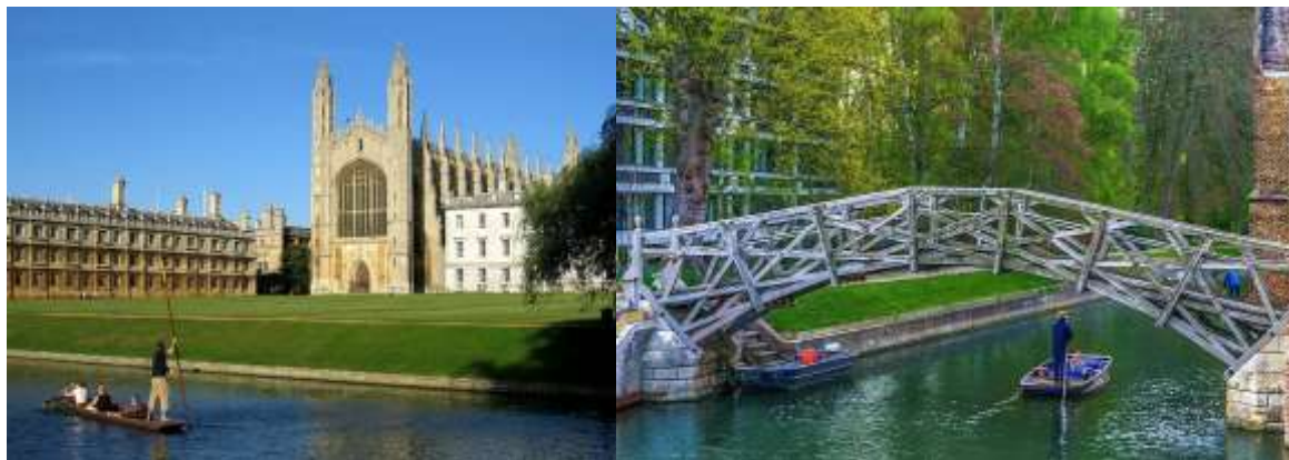
Рисунок 6. – Благоустройство набережной Кембриджского университета у реки Кэм и Математический мост

Кембриджский университет. Кембридж, как и Оксфорд, строился вокруг колледжей с их характерными закрытыми дворами. Одним из самых знаменитых является Большой двор Тринити-колледжа, основанный в XVI столетии. Это пространство имело многогранное назначение: здесь проводились как научные мероприятия, так и игры, а в наши дни оно служит площадкой для выпускных торжеств. Отличительной чертой Кембриджа является интеграция с природным окружением. Территория The Backs, расположенная за колледжами и выходящая к реке Кем, с XVIII в. используется для досуга, включая прогулки, активные занятия и пикники. Мосты, в том числе знаменитый Математический мост в Куинз-колледже, и живописные сады завершают этот уникальный архитектурно-ландшафтный комплекс (рисунок 6 [11; 12]).