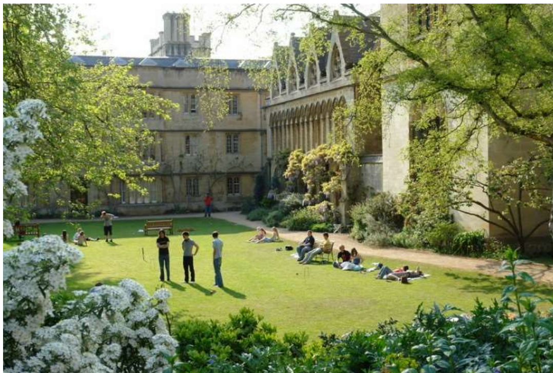
Рисунок 7 – Один из внутренних дворов Кембриджского университета