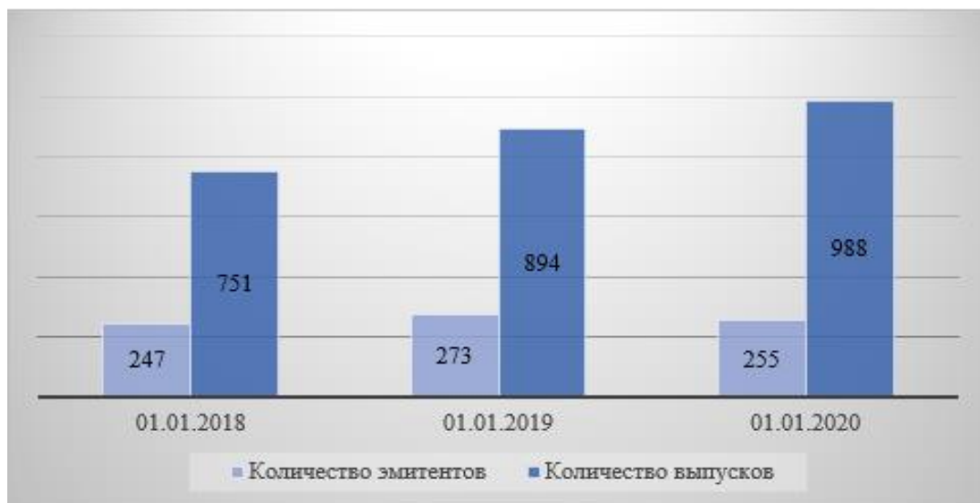
Рисунок 1. – Эмитенты и выпуски облигаций в обращении

Для большей наглядности представим данные на рисунке 1.