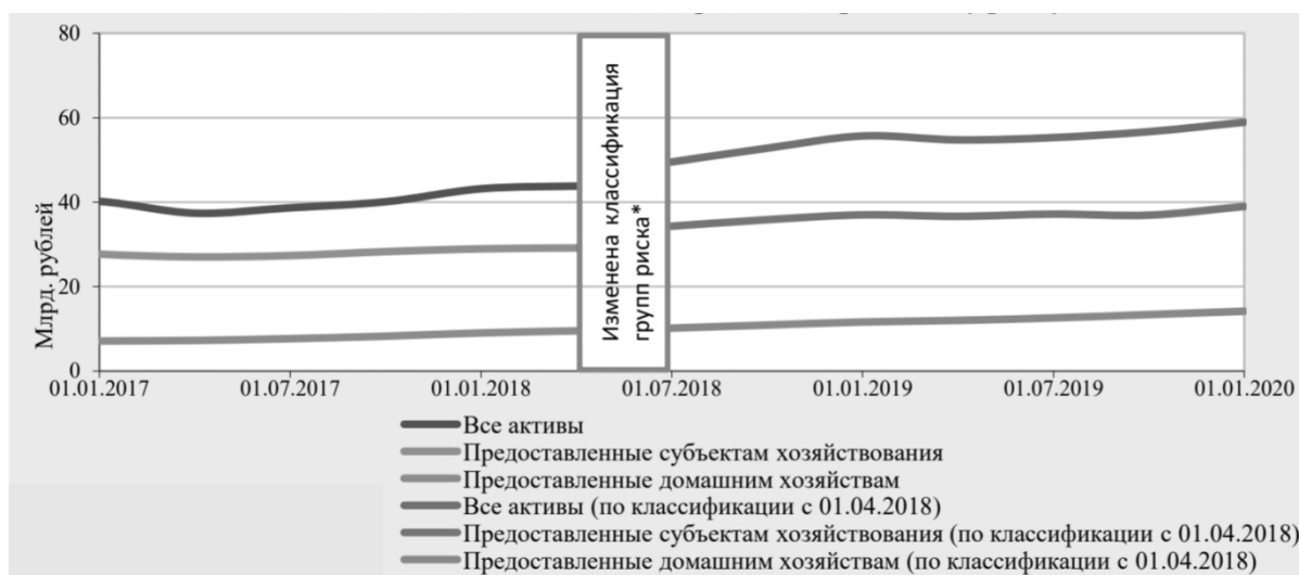
Рисунок 1. –Динамика активов, подверженных кредитному риску

Наиболее значимым риском, оказывающим негативное влияние на устойчивость банковского сектора, в 2019 году являлся кредитный риск. Существенное влияние на изменение доли необслуживаемых активов банков продолжало оказывать финансовое состояние кредитополучателей – юридических лиц, что отразилось в необходимости реструктуризации банками кредитной задолженности и, в случае сохранения у клиентов признаков финансовой неустойчивости, последующем списании данной задолженности на внебалансовые счета за счет созданных специальных резервов. На Рисунке 1 отображена динамика активов, подверженных кредитному риску в 2019 году [1].