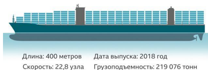
Рисунок 2. – Характеристики контейнеровоза Ever Given

Поскольку с каждым годом в мировом судостроении и судоходстве наблюдаются тенденции к прогрессу (особенно в части контейнерных перевозок), что связано с расширением возможностей судов для перевозок большего объема грузов, то из-за недостаточной пропускной способности Суэцкого канала возникают проблемы дополнительных временных и финансовых затрат.