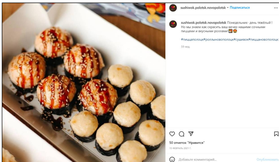
Рисунок 2. – Пример убеждения №2 (Суши Wok)

Убеждение №2. «Понедельник – день тяжелый! Но мы знаем, как скрасить ваш вечер нашими вкусными роллами». Суши Wok убеждает людей в том, что понедельник действительно бывает очень тяжелым днем, но его можно скрасить, заказав роллы этой доставки. Результаты к этому посту являются рекордными в опросе: 95% захотели после увиденного поста заказать суши, 5% – затруднились ответить, а вариант «Нет» не выбрал никто.