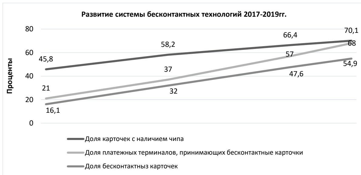
Рисунок 2. – Развитие системы бесконтактных технологий