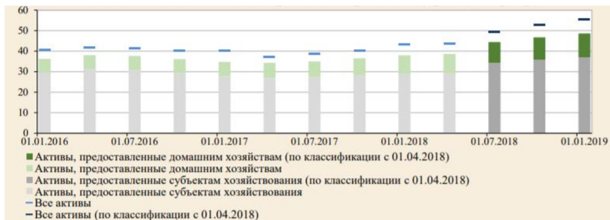
Рисунок 1. – Динамика активов, подверженных кредитному риску

выросла на 0,6 процентного пункта до 6,9 процента. Удельные веса активов, классифицированных по IV, V и VI группам риска составили соответственно 6,8 процента (рост на 0,7 процентного пункта), 1,5 процента (рост на 0,1 процентного пункта) и 0,3 процента (снижение на 0,4 процентного пункта).