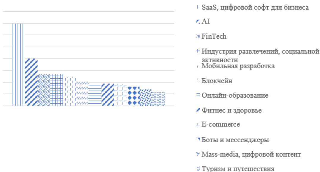
Рисунок 1. – Отрасли белорусских стартапов

Сектора в которых работают стартапы разнообразны. Самыми популярными отраслями среди белорусских стартапов являются SAAS, искусственный интеллект, технологии в области финансов, а также игры и развлечения (рисунок 1).