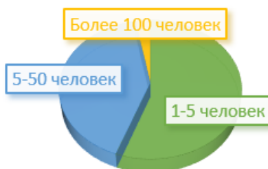
Рисунок 3. – Количественный состав белорусской команды стартапа

Большее половины опрошенных белорусских стартапов имеют не больше пяти человек в команде. Средняя численность работающих в стартапе – 7 человек (рисунок 3).