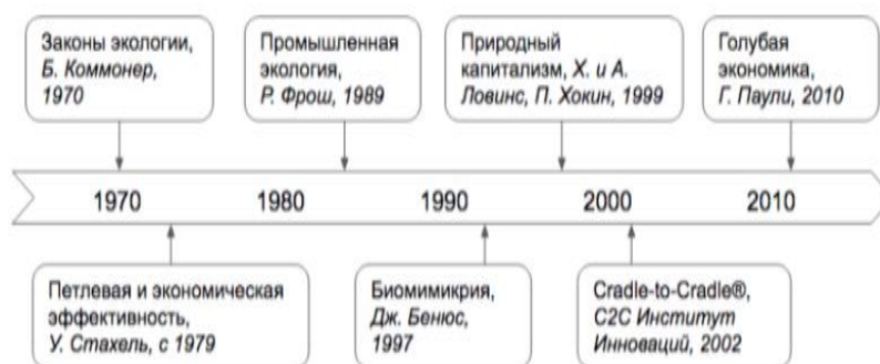
Рисунок 1. – Развитие концепции циркулярной экономики [2]

Концепция циркулярной экономики предлагает переход от линейной модели потребления и производства, где ресурсы используют однократные выбросы после использования, к замкнутому циклу, где ресурсы перерабатываются и используются повторно. Это не только позволяет экономить ресурсы и защищать окружающую среду, но и создает новые экономические возможности, стимулирует создание рабочих мест и инноваций, а также повышает потенциал страны. В 1966 году американский экономист К. Боулдинг заявил, что «Земля превратилась в единственный космический корабль, на котором нет неограниченных резервуаров, поэтому человек должен найти свое место в цикличной экологической системе» [1]. Таким образом, концепция циркулярной экономики объединяет экологию и экономику, и предлагает переходить от потребления и производства к устойчивому использованию ресурсов. Это требует изменения мышления и подходов к производству и потреблению, а также активного взаимодействия между различными заинтересованными сторонами для успешной реализации.