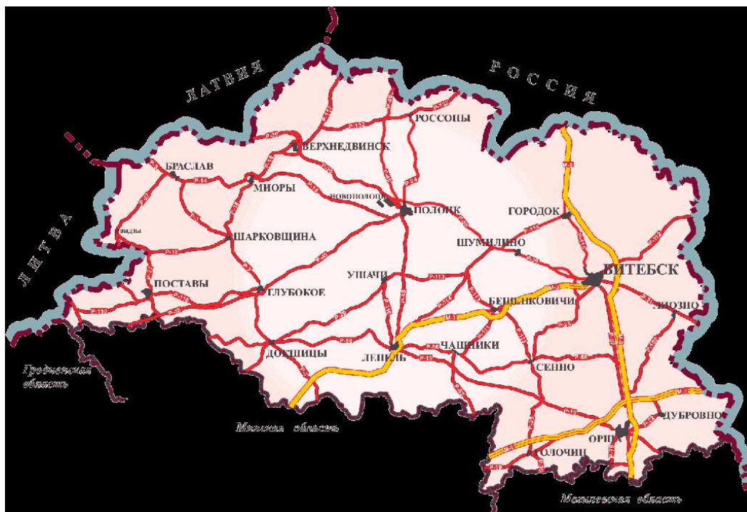
Рисунок 1. – Витебская область на карте Республики Беларусь и Европы

Витебская область расположена на севере Беларуси, в среднем течении Западной Двины и верховьях Днепра. Площадь территории области – 40 тыс. км 2 , или 19,4 % общей площади Республики Беларусь. Протяженность территории с севера на юг составляет от 75 до 176 км, с запада на восток – более 300 км. Внешним окружением области являются Литва, Латвия и Российская Федерация (Смоленская, Псковская области). Общая протяженность границ с сопредельными государствами составляет 933,8 км, в том числе с Россией – 575,8 км, Латвией – 165,8 км, Литвой – 192,2 км. На западе область граничит с Гродненской областью, на юге – с Минской и Могилевской областями Республики Беларусь (рис. 1).