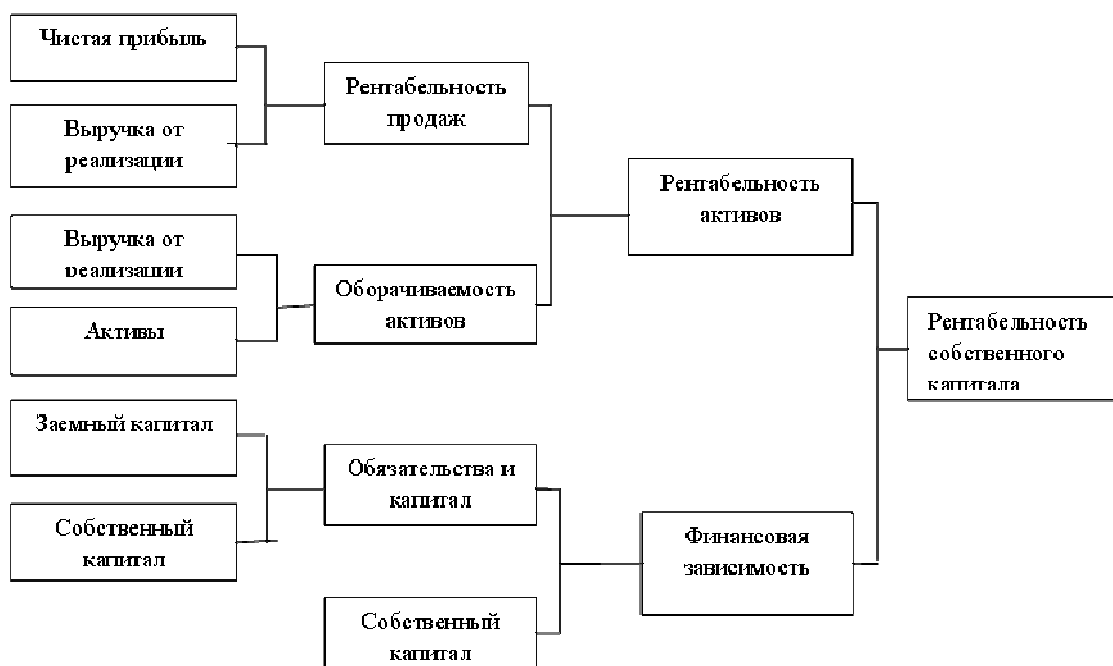
Рисунок 1. – Модель Дюпона