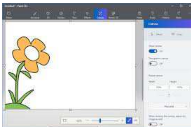
Рисунок 3. – Пример работы в Paint 3D

2 раздел: «Черчение 2D-моделей в Paint 3D» (рис. 3). Интерфейс пользователя. Виды линий. Изменение параметров (редактирование, добавление). Методы и правила введения параметров по клавиатуре. Нанесение размеров. Построение моделей по своим эскизам. Актуальность этого раздела очень даже очевидна, так как в нынешнее время «черчение» возможно не только способом листа и карандаша, но и цифровыми методами.