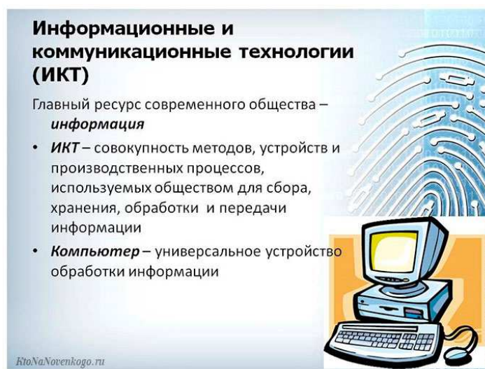
Рисунок 1. – Описание информационно-коммуникационных технологий

Актуальную проблему показывает неправильное объяснение современными учителями, методистами и практиками 3D-моделирования как раздела школьного курса «Трудового обучения», в то время как 3D-моделирование – лишь средства информационно-коммуникационных технологий (рис. 1), которые употребляются на уроках технического труда. Неправильным и недопустимым является представление 3D-моделирования в виде раздела школьного курса информатики с последующим повторением изложенного материала уже на уроках трудового обучения.