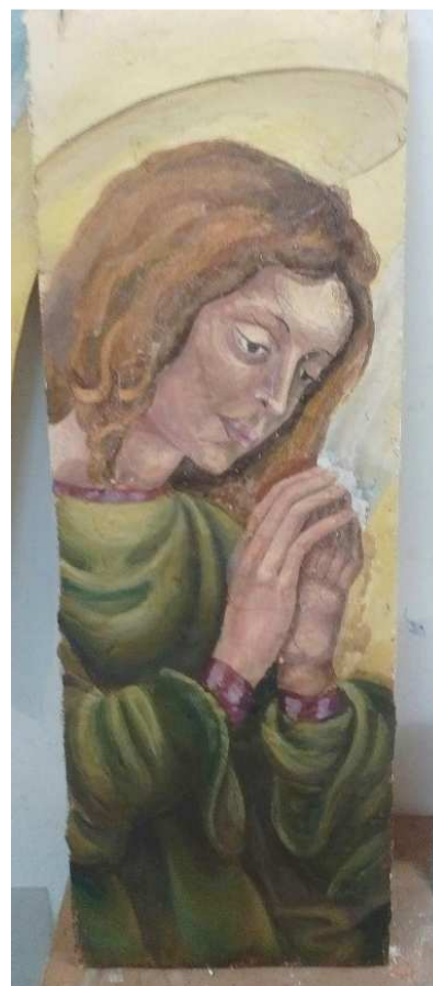
Рисунок 3. – Фреска «Ангел».

Продлав анализ исторически сложившейся техники фресковой живописи, встал вопрос о возможности её применения в наше время. Для этого были упрощены компоненты известково-кирпичной штукатурки и материалы для написания фрески. Это позволило сделать данную технику более удобной для применения в современной предметно-пространственной среде. Однако, в ходе работы написания фрески, возник ряд трудностей. При замещении сухих пигментов обычными акварельными красками появилась проблема яркости и светлости изображения. Так же на конечный результат повлиял выбор количества слоёв штукатурки. В технике написания использовалась однослойная живопись, что повлекло за собой появление трещин. Так же большое внимание нужно уделить используемой поверхности, которая перед написанием фрески требует подробного анализа. Состав поверхности влияет на взаимодействие всех компонентов.