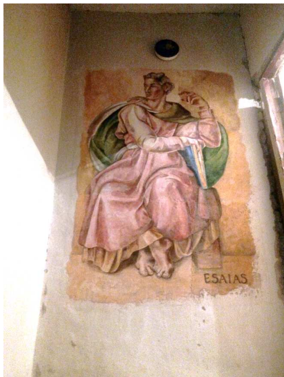
Рисунок 2. – Фреска «Пророк Исайя». Фото автора

При написании фрески можно выбрать не только поверхность стены помещения, но также любую не большую гипсокартонную, и другую прочную поверхность. В таком использовании фреска представляет собой отдельную работу, картину, которой вы можете украсить свой интерьер. Такое использование удобно и в рамках учебного процесса. Это позволяет изучить технологию написания, ознакомиться со всеми нюансами, перед написанием фрески на стене помещения (рисунок 3).