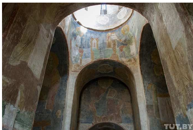
Рисунок 3. – Раскрытые фрески центральной части.

http://поисков.рф/картинка/большая/e34f8a3e9d75b97833f524f396586f09.jpg [3]