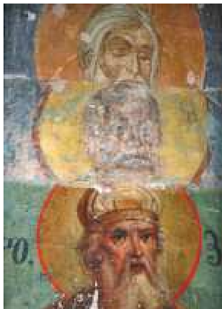
Рисунок 2. – Раскрытие фрески.