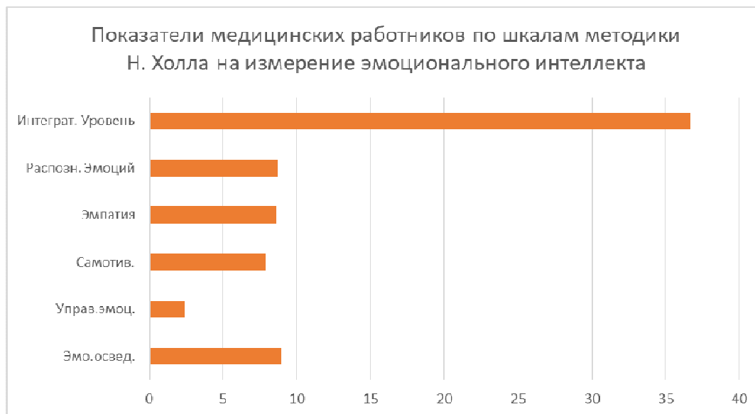
Рис. 1. Средние показатели по шкалам методики измерения интеллекта Н. Холла

На рисунке 1 отображены средние значения выраженности всех 5 шкал методики измерения интеллекта Н. Холла у 101 испытуемого. Как видно из рисунка 1, наиболее выраженной является шкала эмоциональной осведомлённости (9 баллов), а наименее – шкала управления своими эмоциями (в среднем 2,4 балла).