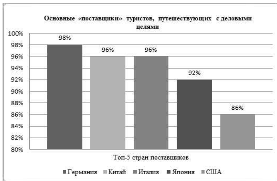
Рисунок 3. – Основные «поставщики» туристов, путешествующих с деловыми целями

В Берлине проводятся четыре из десяти самых популярных немецких ярмарок–выставок: – Международная туристическая биржа – ITB (International Tourisms Borse); – «Зеленая неделя» – Gruene Woche (сельское хозяйство, пищевая промышленность, садоводство, ландшафтный дизайн); – Международная выставка бытовой радиоэлектроники – IFA. Международная выставка бытовой радиоэлектроники IFA занимает в своем секторе первое место в мире. Она собирает в павильонах Messe Berlin свыше 1200 участников из 40 стран и более 250 тыс. посетителей, около 40% которых прибывают на выставку с деловыми целями.