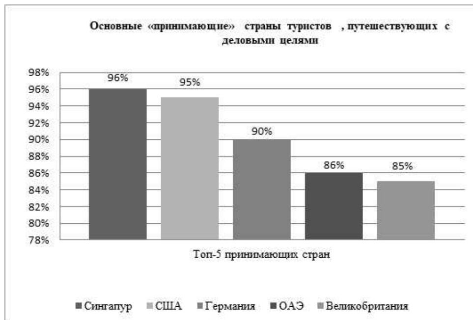
Рисунок 2. – Топ «принимающих» стран основных потоков туристов, путешествующих с деловыми целями

Для более полной картины наглядно стоит рассмотреть статистику основных «принимающих» стран: