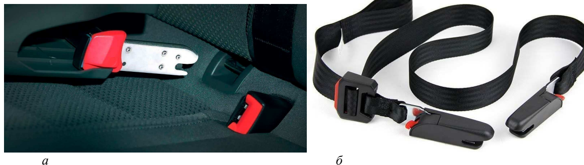
а – крепежи для автокресла в сиденьях автомобиля; б – ремень для крепления автокресла