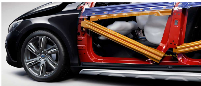
Рисунок 6. – Подножные подушки безопасности и ребра жесткости на дверях