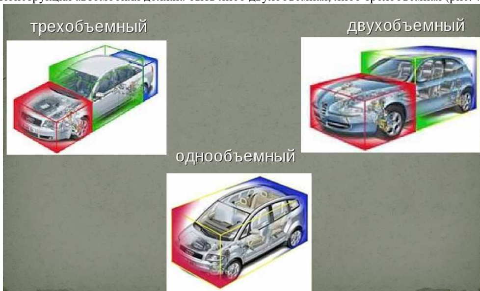
Рисунок 7. – Конструкции автомобиля