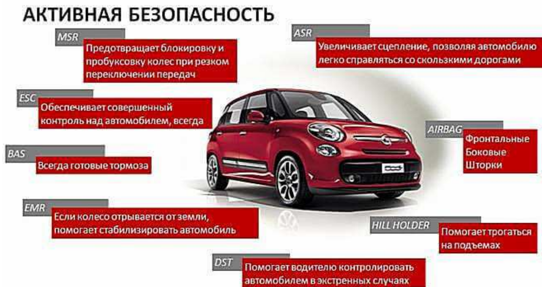
Рисунок 3. – Активная безопасность автомобиля

В ходе исследования активной и пассивной безопасности был выявлен ряд недостатков: