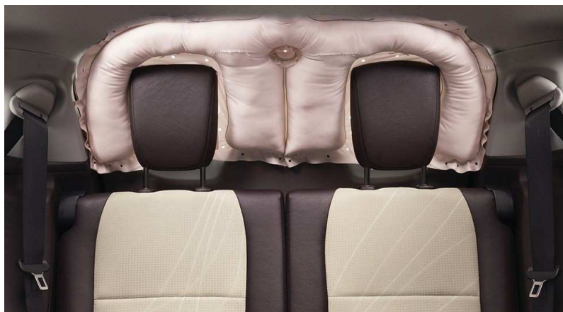
Рисунок 5. – Подушки безопасности для заднего сиденья