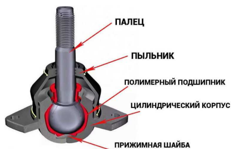
Рисунок 3. – Шаровая опора

Шаровые опоры в ходовой части грузового автомобиля. Главная их функция – это обеспечить возможность поворота на требуемый угол ведущего колеса с сохранением их фиксированных положений в горизонтальных плоскостях.