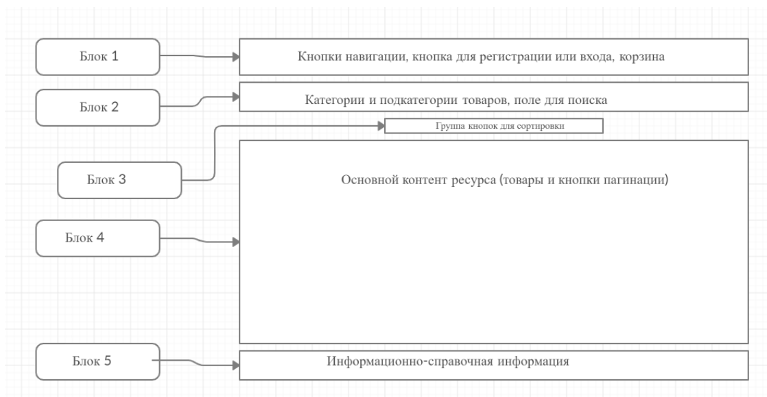
Рисунок 1. – Макет торговой площадки для продажи продуктов пользовательской части

Рассмотрим макет пользовательской части ресурса. На рисунке 1 представлен макет пользовательской части ресурса.