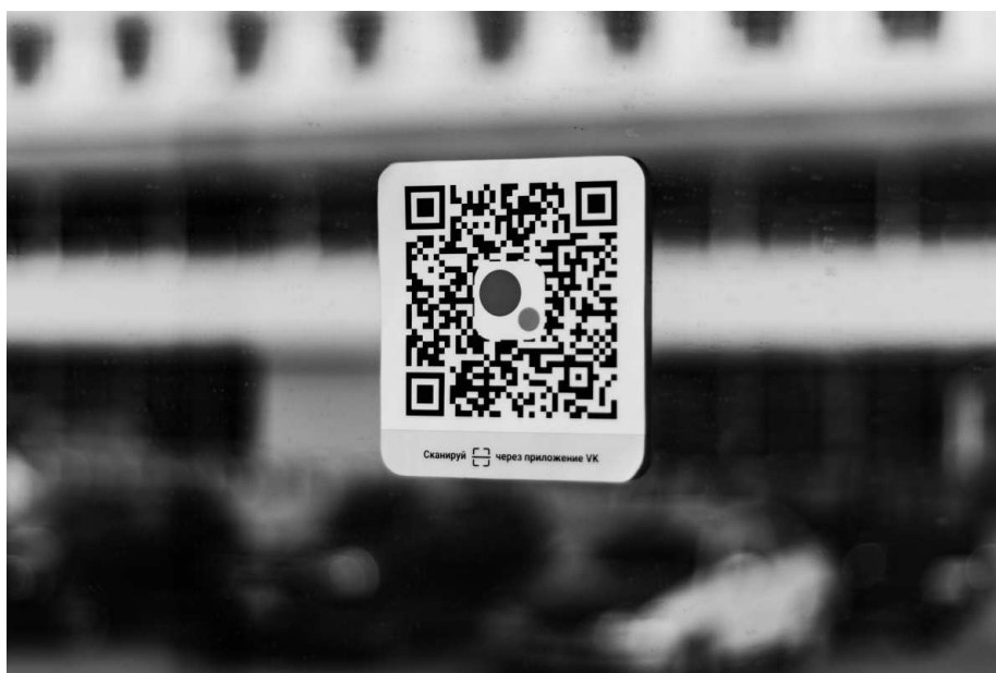
Рисунок 2. – Пример размещения QR-кода

«BEAPP» это именно то универсальное решение, которое вы искали для вашего сообщества в социальной сети ВКонтакте. Сервис поможет вам справиться с множеством задач. А самым главным будет то, что вы сможете взаимодействовать с клиентами на абсолютно новом уровне.