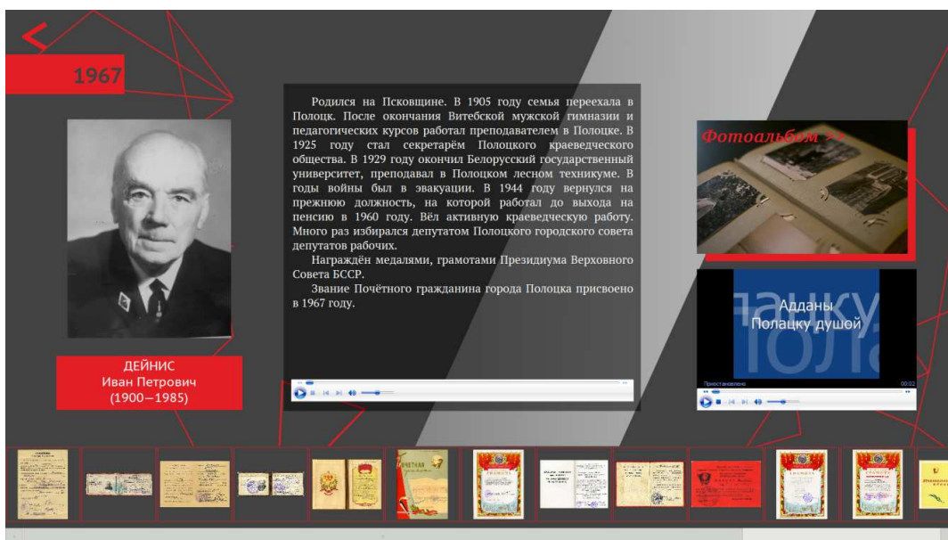
Рисунок 2. – Основной информационный экран о персоналии программной оболочки информационной сенсорной панели «Почётные граждане города Полоцка» с подключёнными блоками контента различного типа