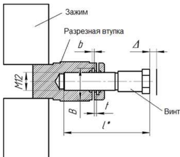
Рисунок 3. – Схема физической модели перемещений

На основе результатов моделирования была разработана математическая модель расчета напряжений и перемещений в блочно-модульных расточных режущих инструментах, позволяющая оптимизировать геометрические параметры винта и разрезной втулки в механизмах настройки режущих лезвий (рис. 3).