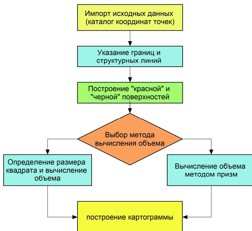
Рисунок 1. – Технологический процесс вычисления объема

Рассмотрим ПО GeoniCS для вычисления объема котлована по двум наборам точек, черновой поверхности и готового котлована. GeoniCS – это универсальная среда для выполнения работ в области геодезии, топографии, проектированию и реконструкции генеральных планов и линейно протяженных объектов (автомобильные и железные дороги, инженерные сети). Основной особенностью продукта является динамическая проектная модель, которая позволяет оперативно и без ошибок вносить изменения в проект на любой стадии проектирования и в любом представлении модели. Продукт отличается универсальностью, что позволяет организовать работу всех групп проектировщиков в единой интерфейсной среде. Технологический процесс вычисления объема земляных работ в GeoniCS приведен на рисунке 1.