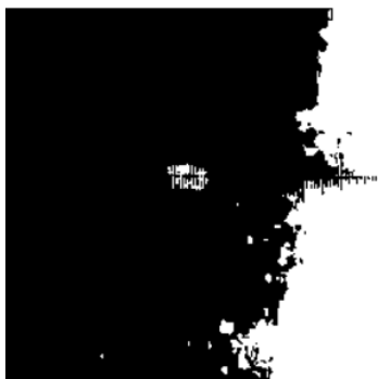
Рисунок 2. – Вычитание второго кадра из фона

Так как кристалл увеличивается по площади с течением времени («растет»), то можно сказать, что его грани «двигаются» во всех направлениях. В данном случае будем рассматривать движение крайних граней кристалла справа и слева. На протяжении всего видео неоднородность фона сохраняется, чтобы частично устранить эту проблему, будем вычитать следующий кадр из «фона», оставляя только «измененные» пиксели изображения. Это выполняет функция cv2.absdiff() .