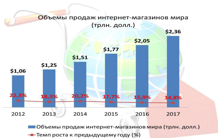
Рисунок 3. – Объемы продаж интернет магазинов

В данном случае достоинства одного вида магазина являются недостатком магазина другого вида.