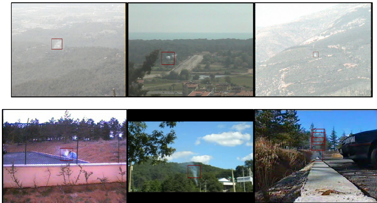
Рисунок 3. – Кадры используемых видеопоследовательностей

Для анализа разработанного алгоритма использовались видеопоследовательности, полученные в условиях реального освещения при съемке вне помещения с различным углом наклона, в том числе и с нестабильным фоном. Работа разработанного приложения представлена на рисунке 3.